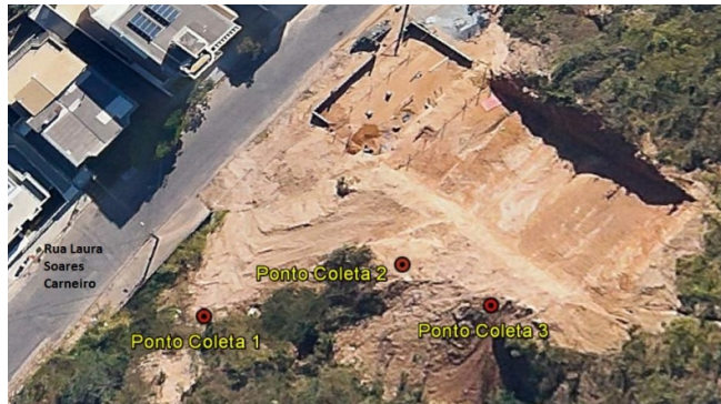
Figura 1: Localização dos pontos de coleta do solo

No dia 21, a temperatura se manteve entre os 25° C e 28° C, além de não ter ocorrido precipitação acumulada (INMET, 2014). Foram demarcados três pontos para a coleta do solo (FIG. 1), em que foram retiradas três amostras, em cada ponto, com o auxílio de um trado, com profundidades variando da superfície aos 45 cm, para que se obtivesse grau de variabilidade. Normalmente, a amostra mais superficial do perfil do solo contém um maior teor de matéria orgânica, sendo que o teor de material inorgânico vai aumentando, de acordo com a profundidade. No dia 29, a temperatura se manteve entre os 25° C e 28° C, além de não ter ocorrido precipitação acumulada (INMET, 2014).