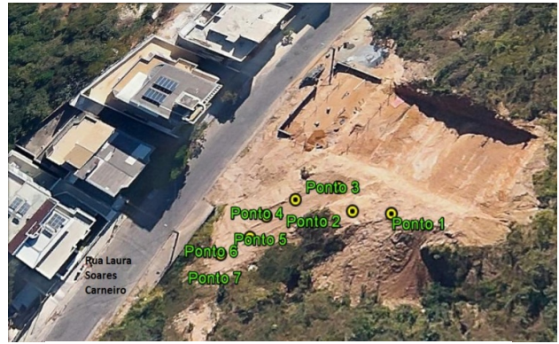
Figura 2: Localização dos pontos para medição

Foi realizada a medição da erosão em si com o auxílio de uma trena, dividindo-a em seis áreas de 5 m 2 e marcando-se sete pontos, onde a profundidade em cada ponto foi demarcada, para que fosse gerada a localização do processo erosivo propriamente (FIG. 2).