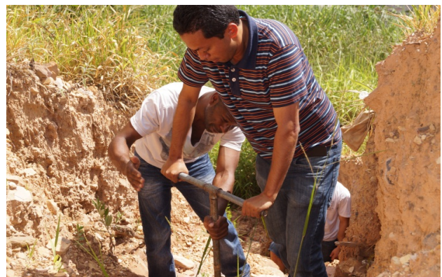
Figura 3: Coleta e acondicionamento de solo, com o auxílio do trado e saco plástico

Foram utilizados o trado Holandês (FIG. 3) e sacos plásticos para a retirada e acondicionamento do solo. A medição da área de estudo foi realizada através de trena, e o GPS foi utilizado para a demarcação das coordenadas e as respectivas elevações dos pontos de coleta (FIG. 4). O GPS foi configurado no DATUM WGS84, pois os pontos coletados foram amostrados através do Google Earth , que utiliza este mesmo DATUM.