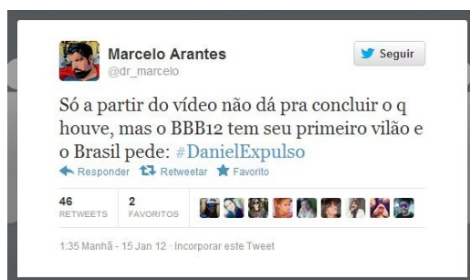
Figura 4: Tweet de Marcelo Arantes

Da mesma forma que surgiram tweets concordando com o argumento de Preta Gil, outros usuários utilizavam a hashtag para se incluir na discussão mesmo que suas opiniões não demonstrassem ser a favor ou contra à expulsão de Daniel. Exemplo disto foi a publicação de Marcelo Arantes (FIG. 4), psiquiatra e ex-participante do BBB , que tentava explicitar que não era possível afirmar o que houve baseando-se somente no vídeo.