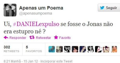
Figura 10: Tweet de Apenas um Poema Fonte: http://twitter.com/apenasumpoema/status/158584591446315008