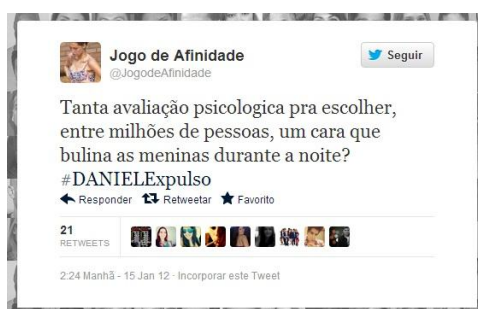
Figura 5: Tweet de Jogo de Afinidade