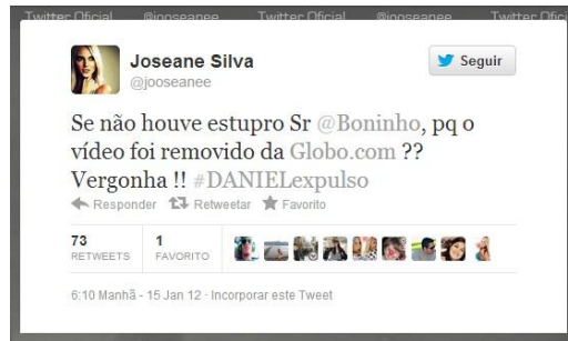
Figura 6: Tweet de Joseane Silva