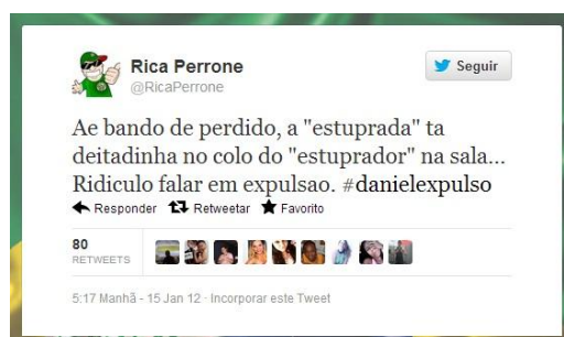
Figura 8: Tweet de Rica Perrone