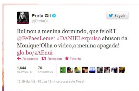
Figura 3: Tweet da cantora Preta Gil.