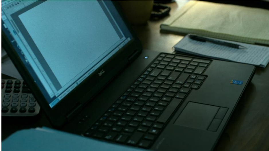
Figura 1: Imagem do computador Dell.

Na sequência da cena, a personagem se levanta para sair da sala e fecha o computador, dando ainda mais evidência à marca, conforme a Figura 2: