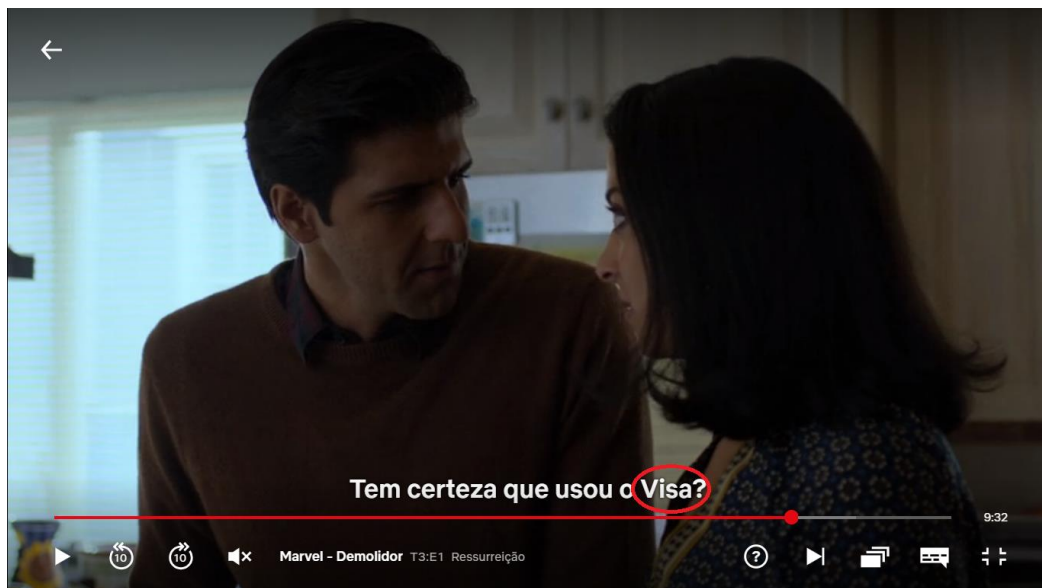
Figura 5: Destaque para a marca Visa na legenda.

Na sequência da mesma cena, a esposa afirma que tentou usar dois cartões Visa e cita, ainda, que tentou usar até um cartão Mastercard , como podemos ver na Figura 6: