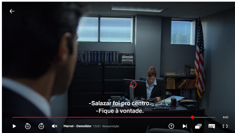
Figura 7: Uso em cena de computador da marca Dell

FBI. Em seguida, que ele chega na sala de outra agente e pergunta por Salazar, e o computador em que ela trabalha é da marca Dell , como podemos ver na Figura 7: