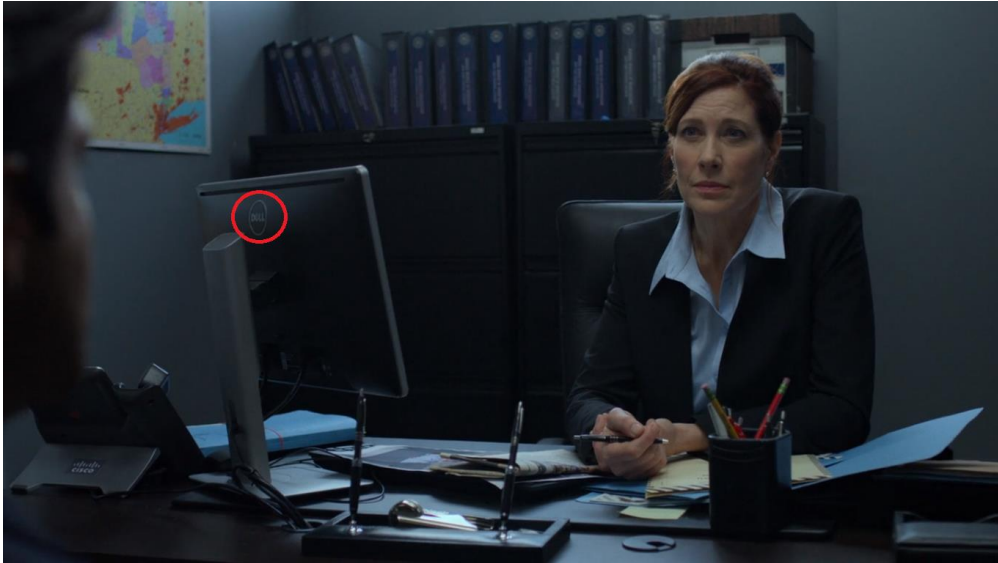
Figura 8: Destaque para a marca Dell.

A personagem explica que o FBI não pode promovê-lo pois, como ele tem crédito negativo, torna-se um alvo vulnerável, não é interessante mudá-lo de cargo. Ele argumenta sobre os problemas da família e diz que a cunhada está doente, mas recebe a informação de que ainda não pode ser promovido até resolver suas finanças. Depois disso, Ray retorna às suas tarefas diárias e vai até a prisão interrogar Wilson Fisk, um dos principais vilões da série. Fisk, convenientemente, lhe pede para fazer um acordo que lhe tire da prisão. Assim, chegamos ao fim do episódio.