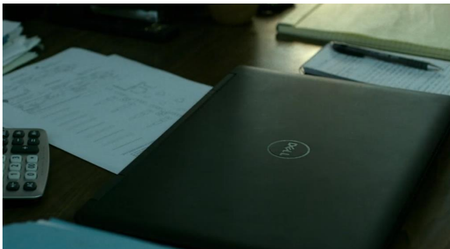
Figura 2: Detalhe da marca Dell no computador.

Na sequência da cena, a personagem se levanta para sair da sala e fecha o computador, dando ainda mais evidência à marca, conforme a Figura 2: