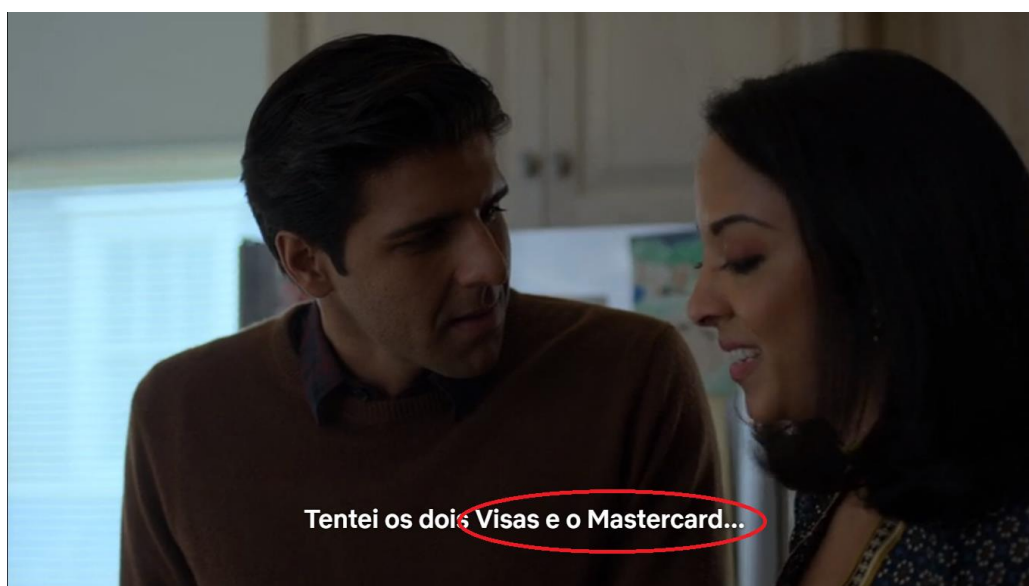
Figura 6: A personagem cita o cartão Mastercard, destacado na legenda

Na sequência da mesma cena, a esposa afirma que tentou usar dois cartões Visa e cita, ainda, que tentou usar até um cartão Mastercard , como podemos ver na Figura 6: