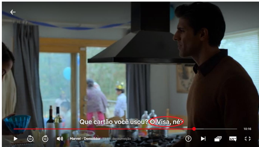
Figura 4: Frame com citação da marca Visa na legenda

no mercado publicitário americano que as marcas rivais citem uma a outra durante alguma propaganda, mas como neste caso ambas são apenas citadas sem afirmar sobre a qualidade de uma ou da outra, temos motivos para acreditar que as duas são apenas meras palavras usadas para dar realidade ao roteiro. Na cena em questão alguns personagens estão em uma festa de aniversário e Ray Nadeem pergunta para a sua esposa se alguns itens da festa foram comprados com o cartão Visa , conforme a Figura 4: